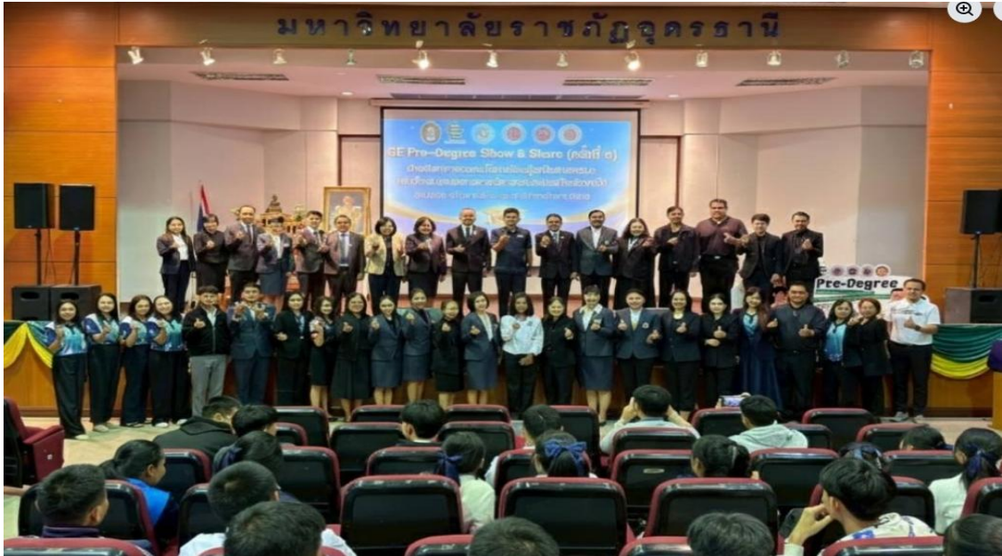
ภาพจากพิธีเปิดโครงการโครงการ GE Pre-Degree Show & Share: ค่ายวิชาการแลกเปลี่ยนเรียนรู้ เสริมสมรรถนะ และนำเสนอผลงานรายวิชาสะสมหน่วยกิตล่วงหน้า

ในปีการศึกษา 2568 นี้ ได้จัดทำระบบกรอกและบันทึกเกรดในระบบ Pre-degree โดยสแกนที่ QR-code