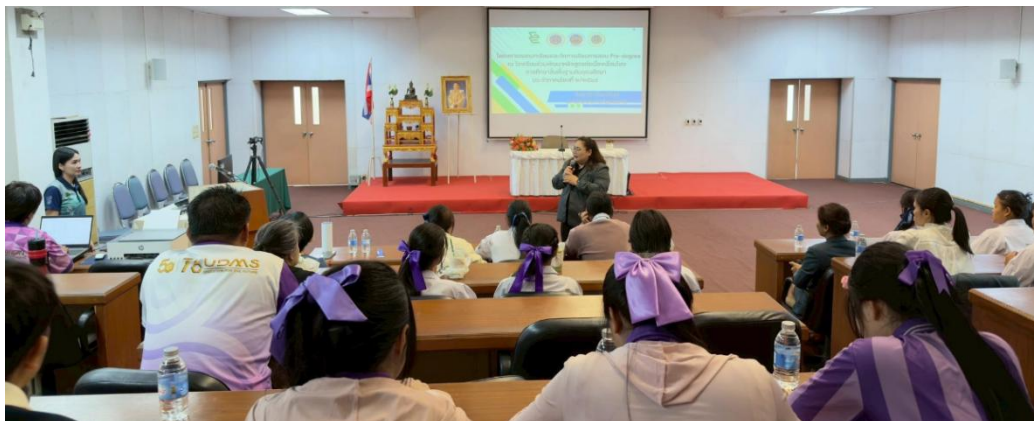
ภาพบรรยากาศการทำกิจกรรมถอดบทเรียน ปีการศึกษา 2568 วันที่ 28 พ.ค.69 ณ ห้องประชุม 2 อาคารเฉลิมพระเกียรติ